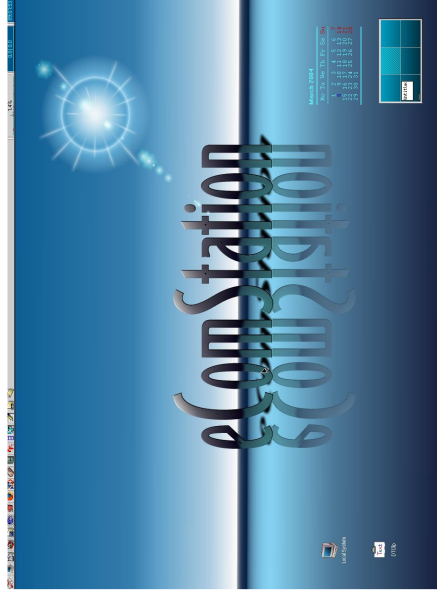
Voorbeeld van een eCS desktop

komt men nog OS/2 tegen. Vaak draait het als "embedded" systeem op de achtergrond. Denk hierbij aan telefooncentrales, betaalautomaten en bijvoorbeeld het seinwezen van de Nederlandse Spoorwegen. Groot voordeel voor de gebruiker is de ongevoeligheid voor spyware, trojaanse paarden en